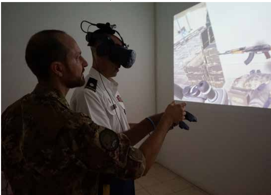
Una rappresentazione grafica del modello simulativo di un'arma, grazie all'ausilio di un visore virtuale