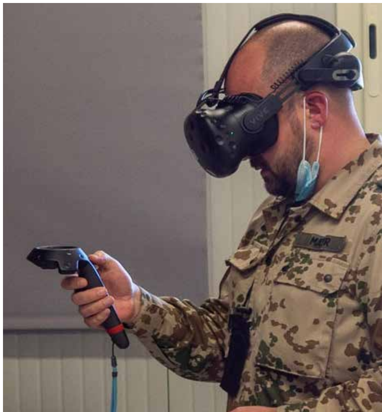
Un militare tedesco impegnato in un'attività di simulazione virtuale

zano quel mix che garantisce un approccio olistico, utile alla risoluzione di problematiche complesse. In proiezione futura, il Centro continuerà nella sua opera di catalizzatore M&S consentendo alla più ampia comunità di interesse militare e civile di connettersi, lavorare insieme ed interagire efficacemente per il raggiungimento di obiettivi comuni sia in ambito nazionale sia in ambito NATO.